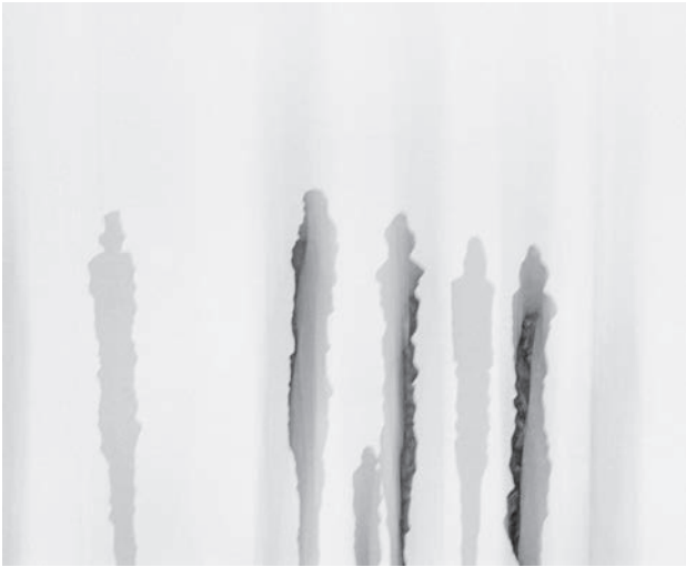
Fig. 14 Photo sculpture 10, d'après A. Giacometti, « la Forêt », 2003, FS 010