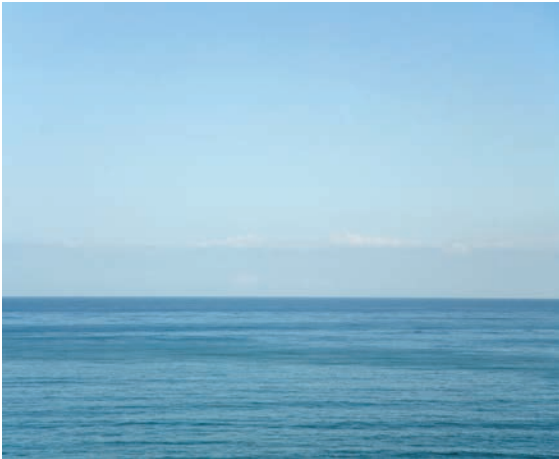
Fig. 7 Horizon 13, 2008, FH 087 de la série « Origine du temps »

NL - Les associations qui s'imposent quand on regarde la série Anfang der Zeit ( Origine du temps) sont les notions d'infini, d'instant zéro, d'éternité. Dans quelle mesure ta photographie traite-t-elle de la dimension temps, et si elle joue vraiment un rôle, comment se reflète cette dimension dans les autres parties de ton œuvre ?