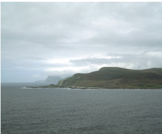
Fig. 3 Lumière irlandaise , 2005, FH 037

NL - La démocratisation de l'art dont tu viens de parler ne conduit pas seulement à une banalisation des motifs dans l'art comme par exemple dans le Pop - Art ou dans la Street Photography. Simultanément, la mise au point de matériel et de processus photographiques de plus en plus simples a entraîné une démocratisation des technologies. Face au torrent photographies qui nous inonde, comment peut-on faire la distinction entre la photo d'art et la photo de vacances ou de famille ?