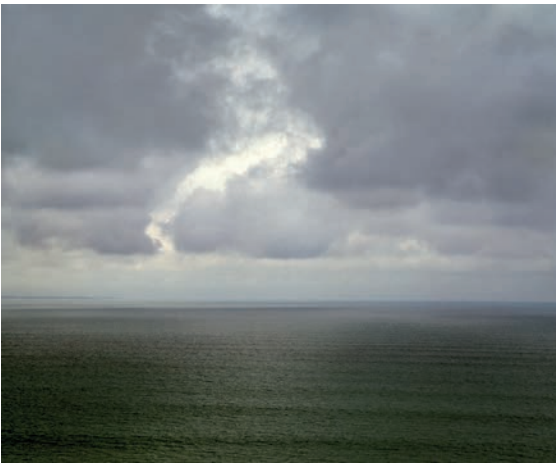
Fig. 2 Horizon 26, 2008, FH 092 de la série « Origine du temps »