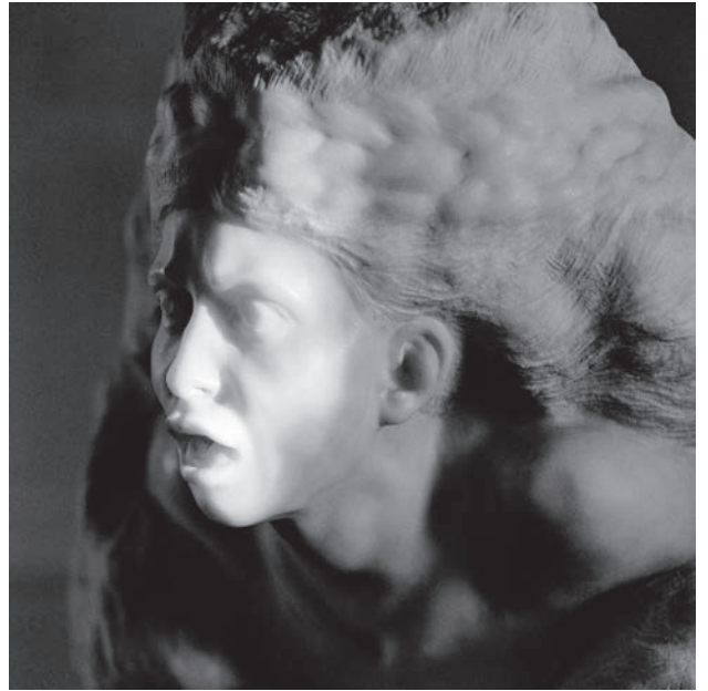
Fig. 5 Photo sculpture 2 , d'après « La tempête » de Auguste Rodin, 1985, FS 002

une expérience intéressante pour soi-même de voir quelles sont les photos qui sont restées dans notre mémoire visuelle. Je dirais que « l'art, ce sont les images que, dans une large mesure, on n'oublie pas ». Avec cette formule simple, on peut différencier assez facilement la photo d'art de la photo de vacances. Il suffit de regarder un bon nombre de photos, et les photos dont on se souvient encore 15 jours après, c'est de l'art. L'art, c'est ce qui fait naître des émotions durables ou des réflexions fondamentales