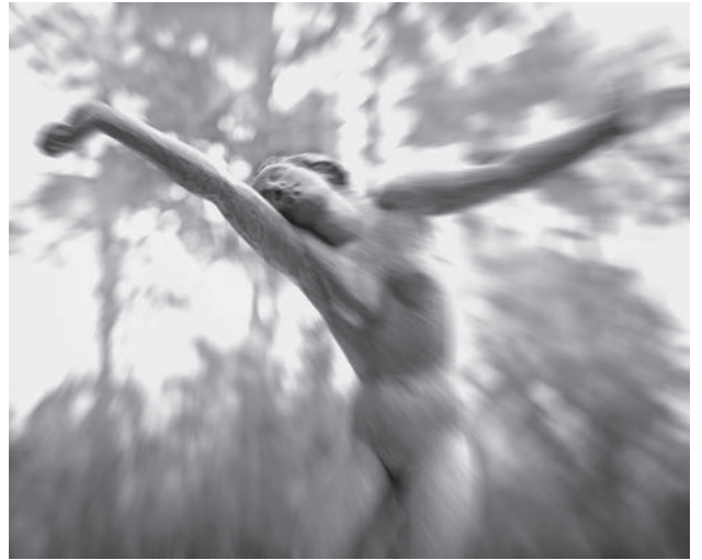
Fig. 15 Photo sculpture 14, d'après G. Kolbe « la fontaine aux danseuses », 1981, FS 015

C'est un avantage qu'il ne faut pas sous-estimer face aux grands formats qui, eux, doivent faire l'objet d'une installation parfois compliquée avant de pouvoir être présentés. La plupart des collectionneurs photo recherche des formats plutôt petits, et ceci explique que Michael Kenna participe au moins à deux expositions par mois.