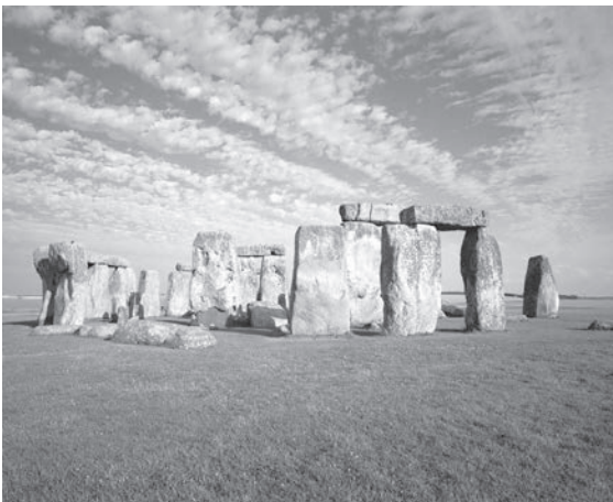
Fig. 12 Stonehenge III , 2002, FM 023 de la série « Patrie des Dieux »

Ce n'est que tard dans ma vie que j'ai découvert l'œuvre du grand photographe américain Harry Callahan, qui pour moi, dans certaines parties, est exemplaire dans sa réduction à quelques contenus dans une image et qui agit ainsi de façon presque minimaliste.