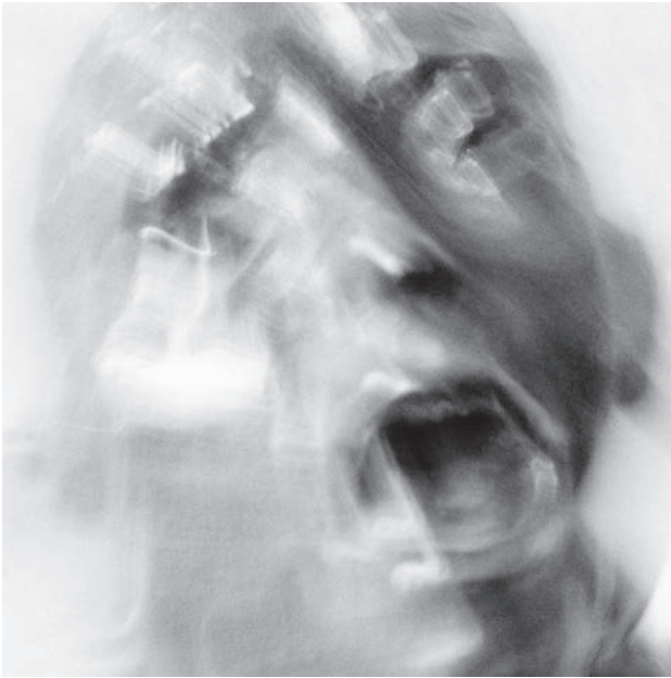
Fig. 4 Photo sculpture 1 , d'après « Le Cri » de Auguste Rodin, 2003, FS 001