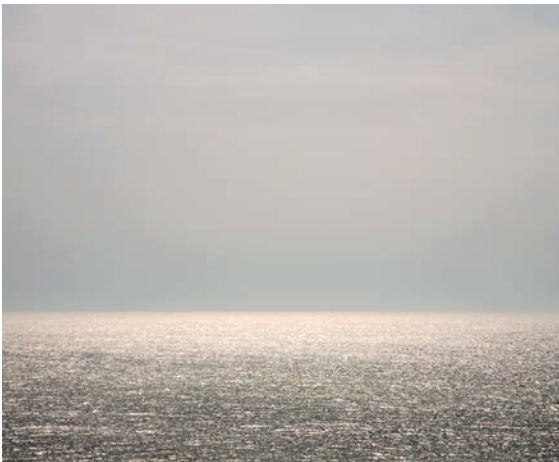
Fig. 6 Horizon 9, 2008, FH 083 de la série « Origine du temps »

La photographie et la sculpture sont bizarrement des arts parents. L'une est forme, l'autre est reproduction. La reproduction reste toujours un enfant de la forme. Grâce à la technique photographique du « flou de la forme », la sculpture, structure rigide, se transforme soudain en illusion de la forme d'origine, ressuscitée en quelque sorte du monde pétrifié de la sculpture figée. En tant que photographe, je m'attache à la sublimation de la sculpture, dans le sens de la délivrer de la pétrification et à faire apparaître un être où coule la vie. C'est ce que je cherche à faire avec cette technique. Le résultat cependant, et arrivé à ce stade, ma démarche semble tourner à l'absurde, n'est plus une sculpture. De fait, je me suis servi de la sculpture pour arriver à mon but final, elle est devenu pour moi un produit intermédiaire, un produit intermédiaire dans ma recherche d'une forme libérée des forces de la gravitation.