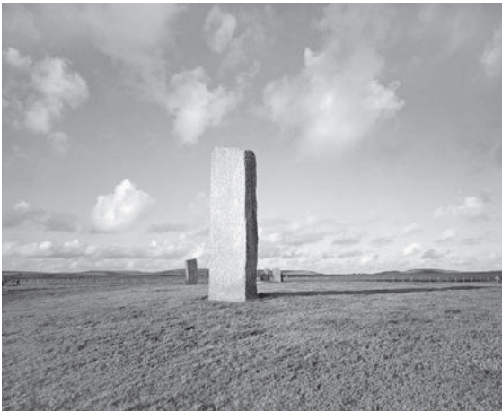
Fig. 13 Menhirs de Stennes III , 2004, FM 031 de la série « Patrie des Dieux »

WL - Toute ma vie, dans mon subconscient, j'ai aspiré à montrer des photos si possible de grands formats mais j'étais rarement prêt à supporter le supplément de travail que représente le transport d'un équipement si lourd. C'est pourquoi la plupart du temps, j'ai utilisé mon Canon ou mon Hasselblad. Et enfin j'ai trouvé un compromis acceptable, avec l'équipement complet Mamiya 7.2-(6x7) que je possède. Les positifs que je peux obtenir à partir des diapositives de cet appareil, atteignent les dimensions de 130x111cm, quand on les reproduit par procédé hybride et qu'on tire des épreuves de qualité exceptionnelle avec une imprimante couleur moderne, à 8 pigments. Je considère ce format suffisamment grand pour pouvoir représenter dignement, même aujourd'hui, à l'époque des grands formats.