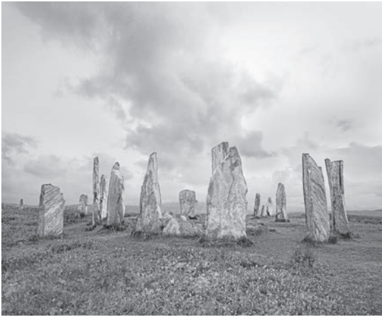
Fig. 11 Cercle de pierres de Callanish II , 2004, FM 041 de la série « Patrie des Dieux »

die Schöpfung ( La création) est le deuxième livre de photos que j'ai possédé, et je l'ai toujours conservé. Haas était en quelque sorte un virtuose de la photographie couleur prise avec un appareil à petit format. Il savait tout faire et il le faisait un peu mieux que d'autres. C'est une bonne base pour de grandes réalisations – surtout en photographie.