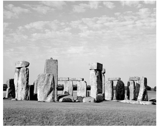
Abb. 10 Stonehenge II, 2002, FM 008 aus der Serie „Heimat der Götter“

die drei ähnlichen Gebilde in ihrer Neigung einem Punkt entgegen. Auch die Fotografien der Steinansammlungen und die Menschen auf dem Markusplatz in Venedig im Widerschein der Sonne sind Formen, die miteinander verbunden sind, vereint in dem Kollektiv eines übergeordneten Zusammenhangs.