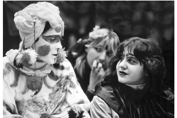
Abb. 4 Blickkontakt , 1981, FP 022 aus der Serie „Menschen heute“

Gesprächspartner, Kontemplations- und Rückzugsmöglichkeit, Erklärungshilfe und nicht zuletzt Partner im Witz. Meine erste intensive Auseinandersetzung mit dem künstlerischen Schaffen meines Vaters geschah dann jedoch nicht im Reich seiner eigenen Zeichnung sondern im Verlauf eines Aufsatzes, den ich über seine fotografische Serie „ Bilder und Zeichen “ verfasste. In dieser Serie bildet er Bilder und Zeichnungen ab, die er als Wandskizzen auf den Mauern der europäischen Metropolen entdeckt hat.