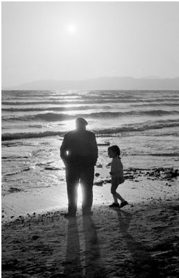
Abb. 2 Alter Mann, Sonne und Kind , 1973, FP 044, aus der Serie „Menschen heute“