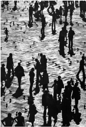
Abb. 8 Tauben, Menschen, Gegenlicht, 1981, FP 014 aus der Serie „Menschen heute“