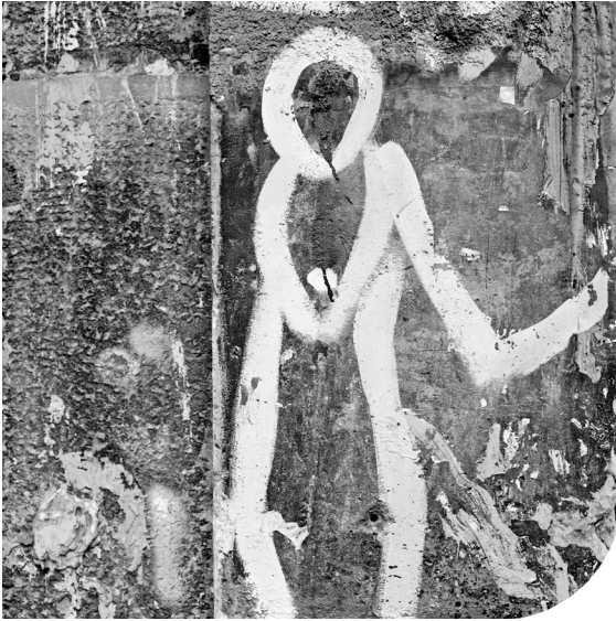
Abb. 1 Hommage an „die Wilden“ , 1999, F 109, aus der Serie „Bilder und Zeichen“