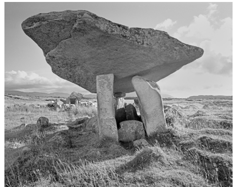
Abb. 7 Kilclooney-Dolmen I , 2002, FM 003 aus der Serie „Heimat der Götter“