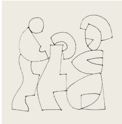
Abb. 3 Bild 02 aus „ Nachtmahl “, Filzstift-Zeichnung, 2007