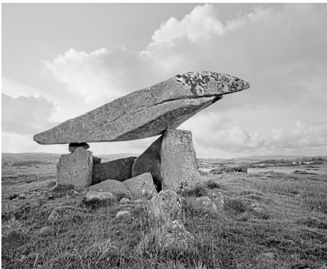
Abb. 5 Kilclooney-Dolmen III , 2002, FM 020 aus der Serie „Heimat der Götter“

Im Vergleich mit den Zeichnungen sehen wir nun erneut eine Parallele. Wir finden zum einen mehrere ähnliche Formen im Interesse eines Zieles vereint, so zumindest interpretiere ich