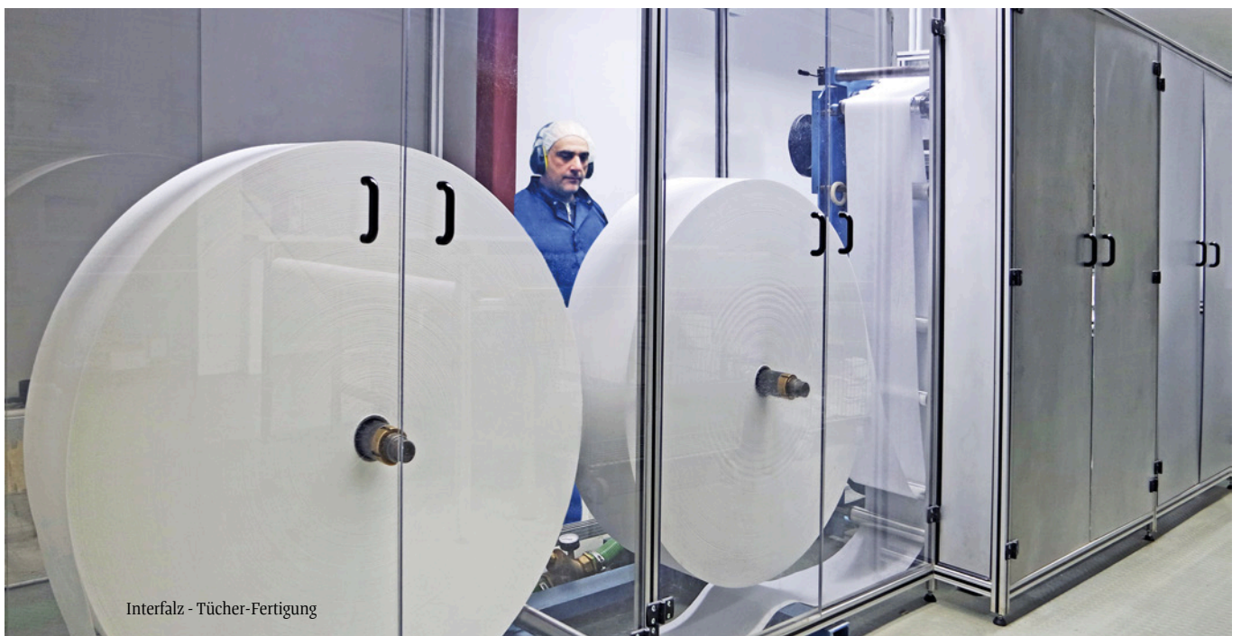
Interfalz - Tücher-Fertigung